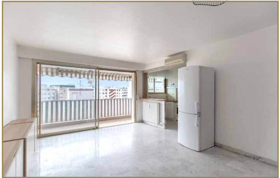
Terrasse du Séjour