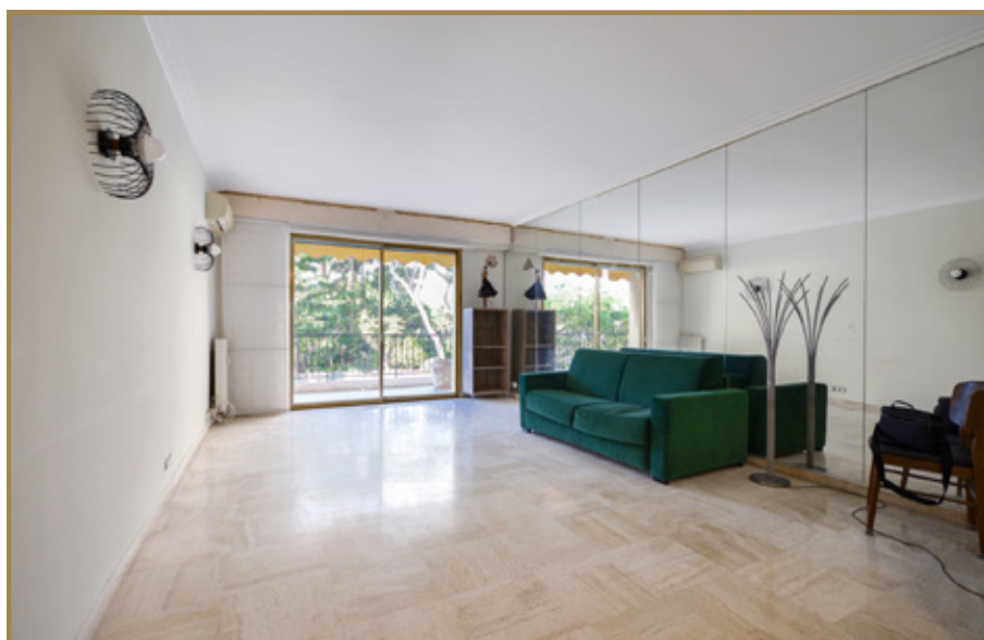
Entrée et Dégagement