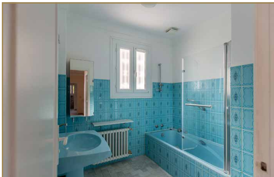
R+1 Terrasse Ch. 01 & 02